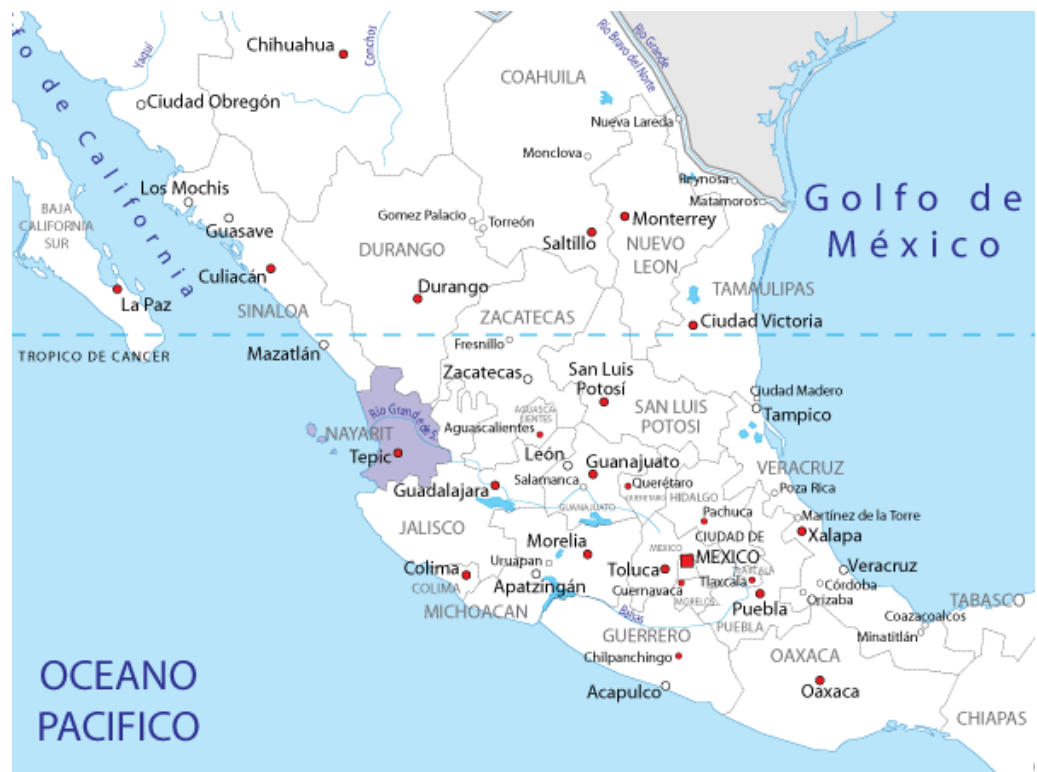
Figura 1, Mapa de México.